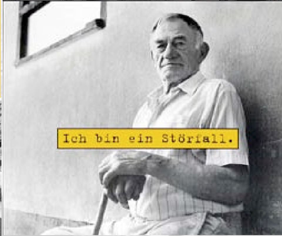
Ich bin ein Störfall.