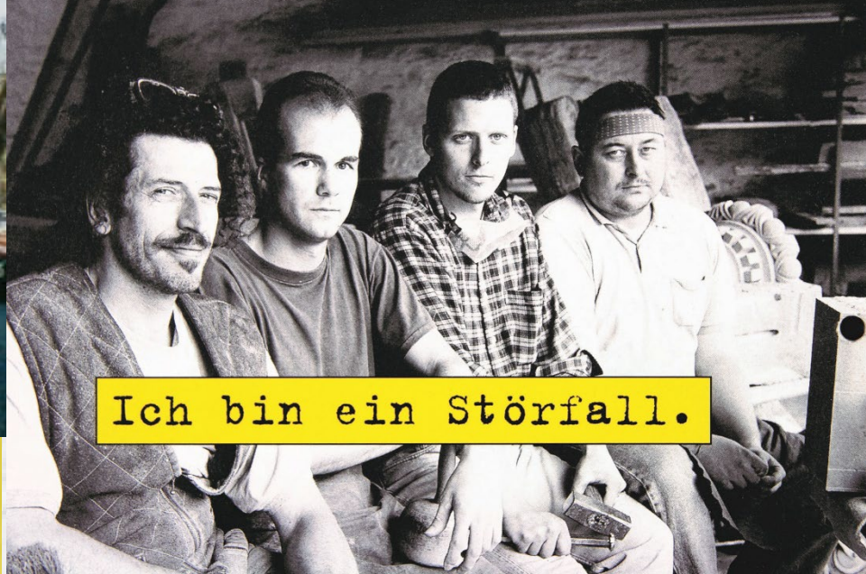
Ich bin ein Störfall.